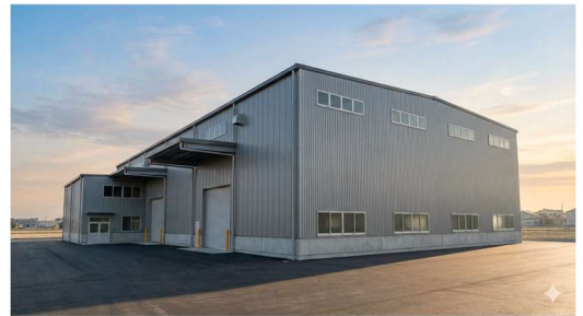
※工場完成イメージ図